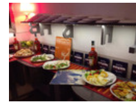
Musica Live Torino

Aperto 7 giorni su 7, dalla colazione, passando per pranzo, aperitivi e dopo cena. Ricavato in un ex cinema, il Blah Blah è sicuramente uno dei locali più amati di Torino, punto di riferimento per la cultura alternativa: concerti indie, rassegne cinematografiche, teatro riempiono le serate di questo locale in pieno centro a torino